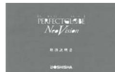
製品付属の取扱説明書

取扱説明書11ページの「最新情報に更新するために①」、12ページの「最新情報に更新するために②」をご参照の上、続けて下記手順での更新をお願いします。